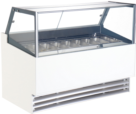
This photo is showing ice cream display Borneo 12x5L. Model 7487.0255 has a capacity of 9x5L.

Cette vitrine à glace est la solution idéale pour présenter et conserver les glaces en boule, parfaite pour les glaciers, les établissements de restauration ou les événements. Grâce à son refroidissement ventilé, la température est répartie de manière homogène, tandis que le dégivrage automatique facilite l'entretien. L'éclairage LED assure une présentation attrayante des glaces, incitant les clients à faire un choix gourmand. Avec un espace suffisant pour 9 bacs de 5 litres, cette vitrine offre une capacité de stockage optimale. Dimensions: 1260x880x1300 mm (LxPxH) - Capacité: 285 litres - Température: -16/-18°C - Consommation d'énergie: 1,05 kW - Poids: 195 kg.